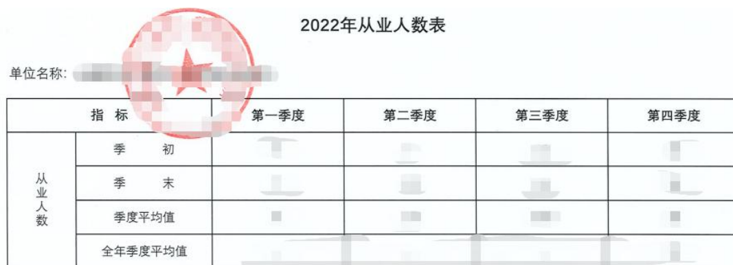
图 6 从业人员名单总表示例