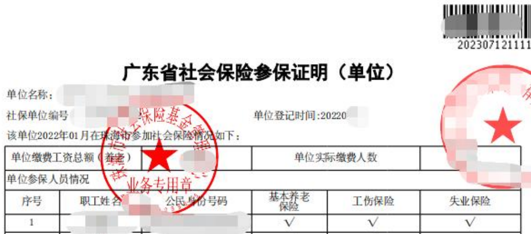
图 8 社保缴纳证明示例二